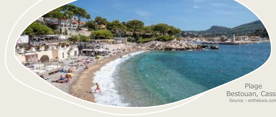
Plage Bestouan, Cassis

En quoi l'étude de l' identité de lieu est opportune pour concevoir des stratégies d'adaptation ?