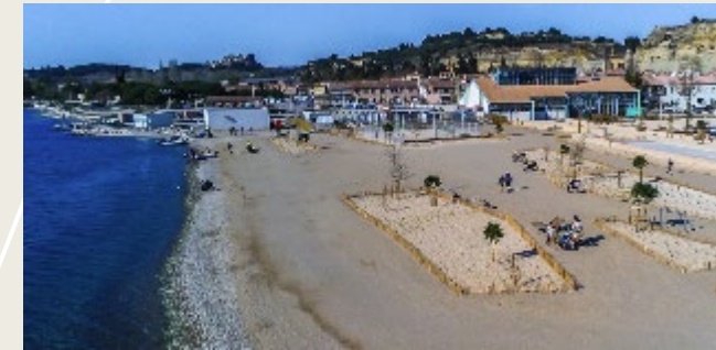
Plage des Cabassons, Saint Chamas