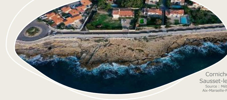
Corniche de Sausset-les-Pins