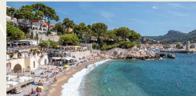
Plage Bestouan, Cassis