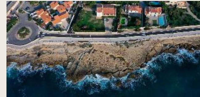
Corniche de Sausset-les-Pins